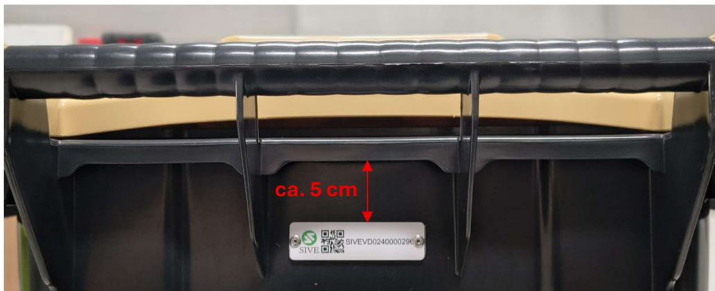
Foto 2: Posizione Tag-RFID in contenitore con 4 (o più) nervature di rinforzo Tag-RFID da rivettare al centro a ca. 5 cm dal bordo superiore del fusto